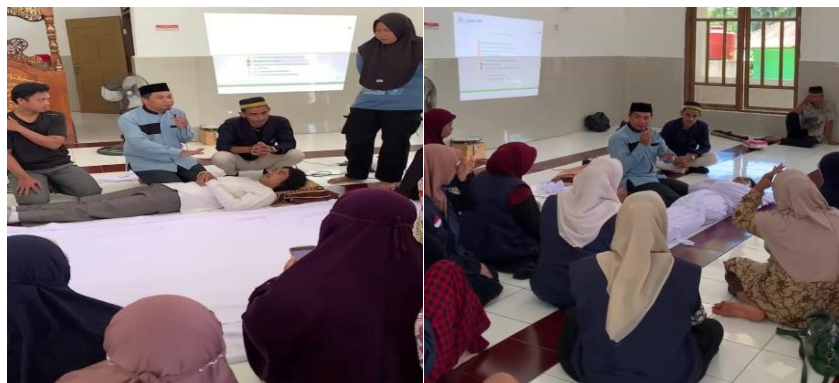
Gambar 4. Simulasi dan Praktik Mandiri oleh Peserta

bertujuan untuk mengintegrasikan pengetahuan teoretis dengan keterampilan praktis secara menyeluruh. Dalam tahap ini, peserta diberi kesempatan untuk melakukan praktik lengkap seluruh proses pemulasaraan jenazah, mulai dari memandikan, mengafani, menshalatkan, hingga menguburkan jenazah, dengan bimbingan instruktur yang berpengalaman. Praktik dilakukan menggunakan alat peraga dan perlengkapan yang sesuai dengan standar syariat Islam serta protokol kesehatan terkini, termasuk penggunaan alat pelindung diri (APD). Pendekatan ini memungkinkan peserta mengalami langsung berbagai kondisi nyata, termasuk penanganan jenazah dengan luka atau penyakit menular, sehingga mampu meningkatkan keterampilan psikomotorik dan membangun kepercayaan diri dalam menjalankan tugas sosial keagamaan secara benar dan aman. Terkait praktik mandiri oleh peserta dapat dilihat pada gambar 4 berikut ini: