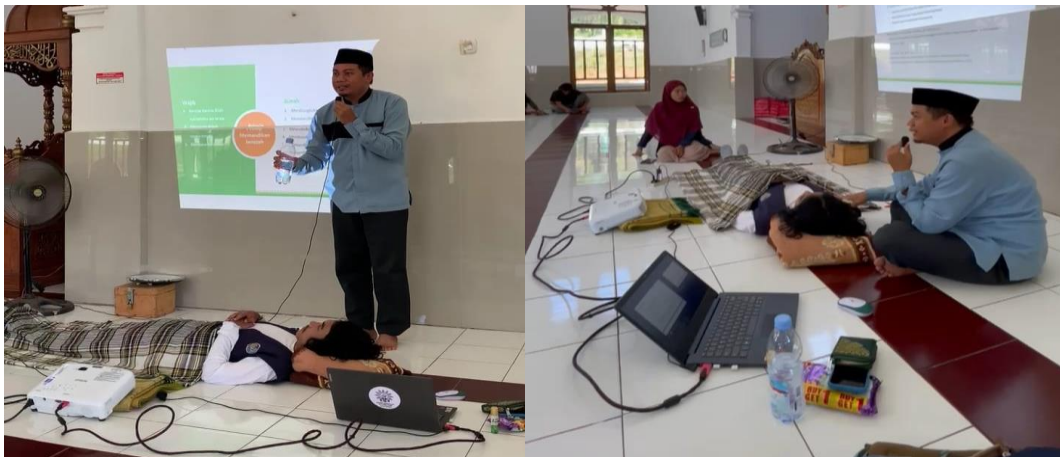
Gambar 3. Demonstrasi Praktik oleh Fasilitator

Fasilitator juga menjelaskan adab dan etika dalam pengurusan jenazah, menekankan pentingnya menjaga kehormatan jenazah dan empati kepada keluarga yang berduka.