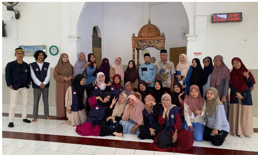
Gambar 5. Foto bersama peserta

Diakhir kegiatan dilakukan foto Bersama sekaligus memberikan motivasi kepada seluruh peserta seperti yang terlihat dalam gambar 5 berikut ini: