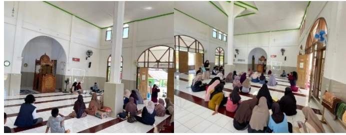
Gambar 1. Sambutan dan pengenalan materi