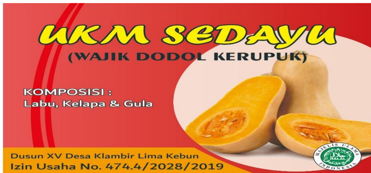
Gambar 3: Desain Merek Produk Terbaru

Gambar dari produk di atas itu masih menggunakan desain merek lama dan sekarang kelompok ibu rumah tangga telah membuat desain merek terbaru, seperti Gambar 3 sebagai berikut: