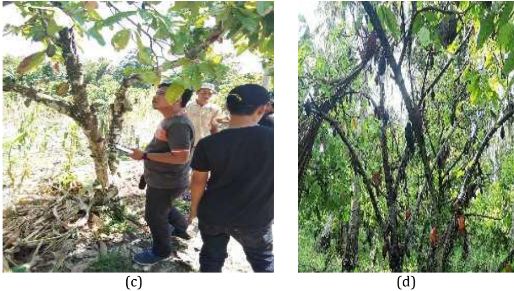
Gambar 2. Diskusi dengan Anggota Kelompok Tani (A), Gejala Serangan Penggerek Buah Kakao (B), Pengamatan Langsung pada Tanaman Kakao (C), Gejala Serangan Busuk Buah Kakao (D)

Program revitalisasi pengembangan tanaman kakao di daerah Kabupaten Kolaka Utara diawali dengan kegiatan evaluasi lahan untuk menentukan kesesuaian lahan melalui pertimbangan kondisi iklim, kondisi biofisik lahan dan kesuburan tanahnya, serta memetakan lahan yang sesuai untuk pengembangan budidaya tanaman kakao. Hasil penelitian evaluasi lahan ini diharapkan dapat digunakan sebagai pedoman penyusunan kebijakan dalam program revitalisasi pengembangan tanaman kakao melalui pemanfaatan lahan produktif maupun perbaikan kondisi lahan marginal.