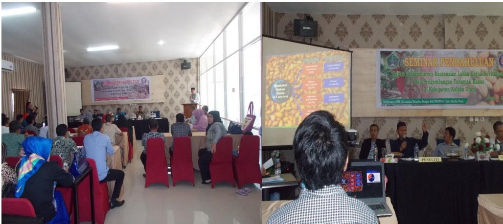
Gambar 1. Tim Pelaksana Kegiatan Pengabdian pada Masyarakat sedang Memaparkan Materi

peserta (Gambar 1) dan diskusi di lapangan dengan melihat langsung gejala serangan penyakit busuk buah tanaman kakao (Gambar 2).