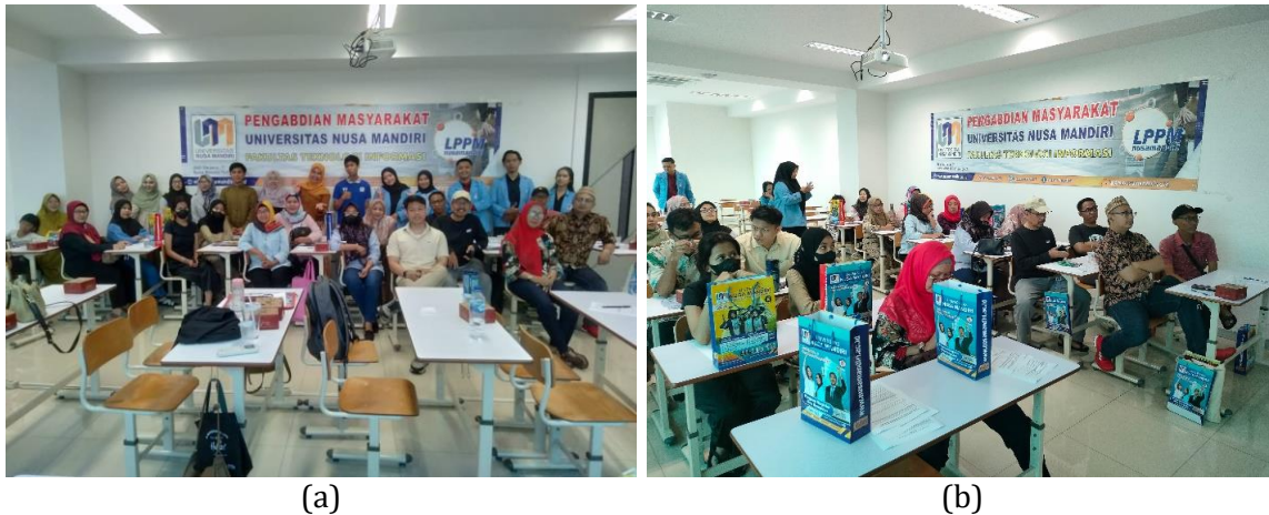
Gambar 1. Pengabdian Masyarakat berupa Pelatihan workshop pemeliharaan website Sistem Administrasi RW013 Cipinang Melayu Jakarta Timur.

Press release berita yang sudah diterbitkan pada tanggal 18 Desember 2023 dengan judul berita “Dosen UNM Berikan Sosialisasi Keberlanjutan Dalam Pemeliharaan Situs Web Sistem Administrasi Pada Warga RW 013 Cipinang Melayu” pada link publikasi sebagai berikut: https://news.nusamandiri.ac.id/2023/12/18/dosen-unm-berikan-sosialisasi-keberlanjutan-dalam-pemeliharaan-situs-web-sistem-administrasi-pada-warga-rw-013-cipinang-melayu/ pada media news.nusamandiri.ac.id.