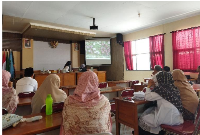
Gambar 1. Paparan materi workshop dan diskusi penyusunan perangkat pembelajaran berbasis proyek

bermitra dengan sekolah akan dilaksanakan kegiatan serupa yang sarasannya lebih luas yang membutuhkan wawasan dan keterampilan mengenai penyusunan perangkat pembelajaran yang mendukung kurikulum merdeka yang mengakomodir keterampilan abad 21 yang masih belum diimplementasikan secara maksimal di sekolah-sekolah.