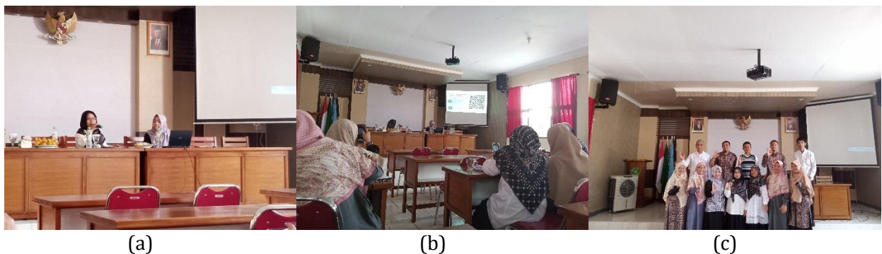
Gambar 2. Pendampingan penyusunan perangkat pembelajaran berbasis proyek (a) Paparan materi workshop (b) Diskusi penyusunan perangkat pembelajaran berbasis proyek (c) Workshop penyusunan Perangkat pembelajaran