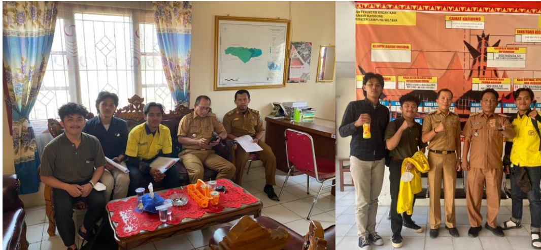
Gambar 2 Kegiatan social mapping pada desa di Kabupaten Lampung Selatan.

Indeks Kesiapsiagaan Masyarakat merupakan cara menilai suatu kelompok masyarakat disuatu daerah dalam kesiapsiagaan menghadapi ancaman bahaya. Penilaian indeks kesiapsiagaan masyarakat ini merupakan salah satu parameter untuk menilai suatu kapasitas daerah. Kegiatan pengambilan data ini dikenal dengan istilah social mapping . Kegiatan social mapping dilakukan pada beberapa desa disetiap kecamatan. Pengambilan sampel ini didasari dari tingkat kelas bahaya yang tinggi dengan kemudian dilakukan pendekatan statistik untuk menilai kelas kesiapsiagaan di desa sekitarnya.