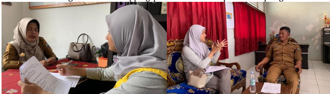
Gambar 3 Kegiatan wawancara pada tokoh masyarakat dalam kegiatan social mapping